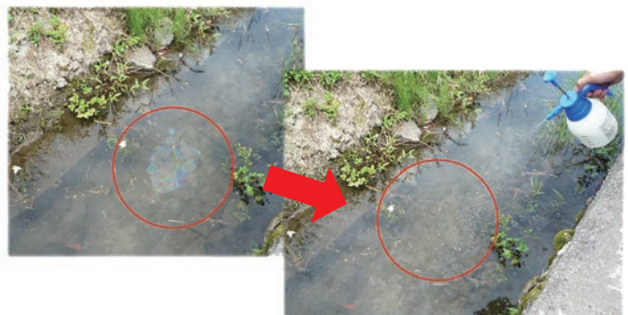
水田の水路に機械油が漏れ、油紋が発生。 ミセルクリーンを噴霧すると 瞬時に油紋が消滅 しました。